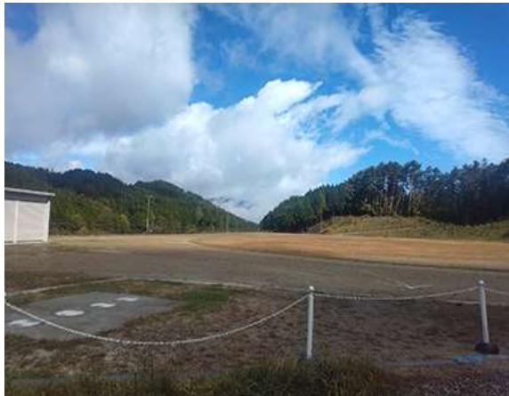
売木新総合グラウンド