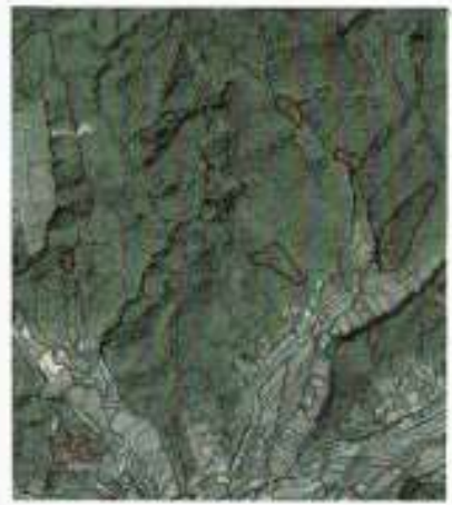
売買対象原野(積立山林)一覧表

赤松・檜・雑木のエリア、 竹林・雑木のエリア、 松茸等茸・山菜、 竹の子の採取も可能